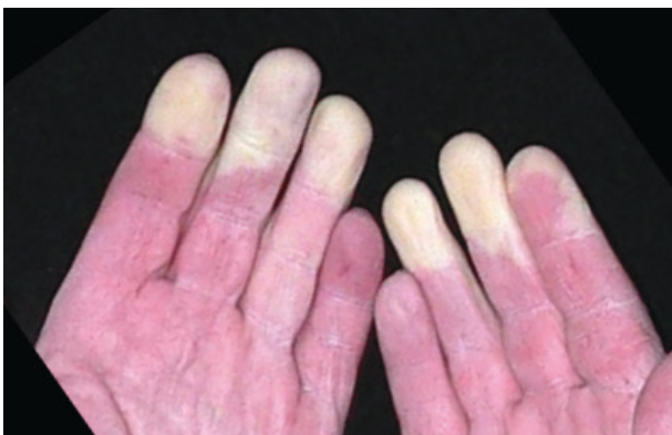
Exempel på "vita fingrar".

Tänk på att de flesta vibrerande maskiner även orsakar kraftigt buller. Risken för hörselskada är därmed uppenbar. Om du märker att du tillfälligt hör sämre, eller att det susar eller ringer i öronen är det tecken på att du utsatt dig för skadliga ljudnivåer. Kortvariga, men mycket höga ljud är direkt skadliga, t. ex. smällar från slående maskiner.