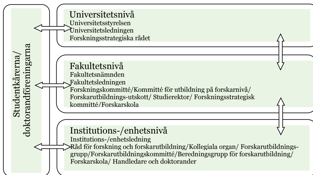
Figur. 1. Organisation för kvalitetsutveckling för utbildning på forskarnivå vid Umeå universitet. Förutom ledningsansvar finns olika organ där frågor bereds och beslutas. Dessa listas för de olika nivåerna.

Doktorander och handledare ansvarar för att utbildningen genomförs ansvarsfullt och professionellt i enlighet med specificerade mål.