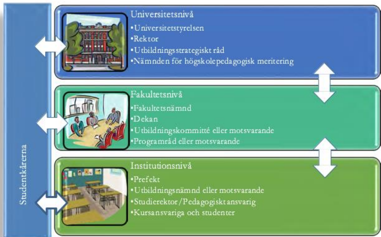
Figur 2 Organisation för kvalitetsutveckling vid Umeå universitet

Ansvarsfördelningen mellan dekan, fakultetsnämnd och prefekt regleras i respektive fakultets delegationsordning och tillämpliga handläggningsordningar.